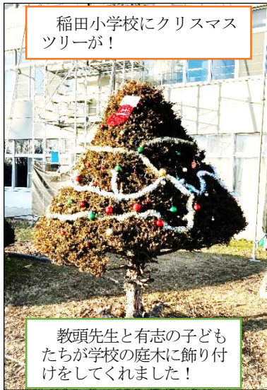
稲田小学校にクリスマスツリーが！