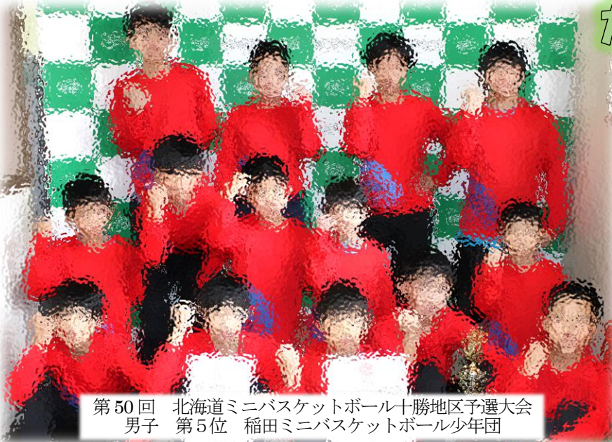
第50回 北海道ミニバスケットボール十勝地区予選大会 男子 第5位 稲田ミニバスケットボール少年団