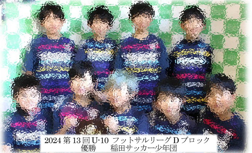
2024 第13回 U-10 フットサルリーグ Dブロック 優勝 稲田サッカー少年団