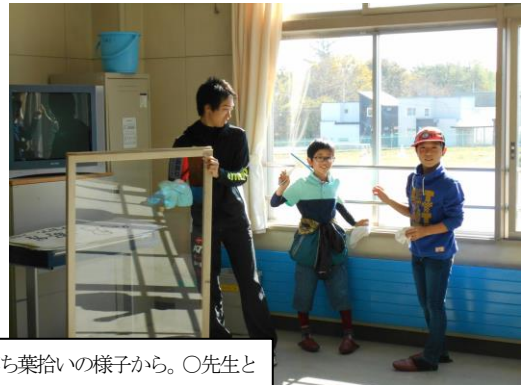
写真左上から時計回りに、○落ち葉拾いの様子から。○先生と子どもと一緒にガラス拭き。○子ども同士向き合ってガラスの拭き合い。○高いところはお任せのとっと倶楽部の作業から。