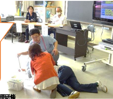
8月17日 安全管理研修