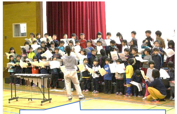
1年生は初めての大舞台。歌に器楽とはりきって練習しています。

20日の学習発表会に向け、各学年では練習に力が入っています。この学習発表会は子ども達の表現力を鍛え、高めていく絶好の機会です。この取組を通して、演技や演奏、合唱等「はっきり、ゆっくり、大きな声で、気持ちを乗せて」みんなが心一つにして練習に励んでいます。学年で一つのものを作り上げて発表することで、達成感も感じてほしいと願っています。ご家庭におかれましては、やる気を高める声かけとともに、本番までのお子さんの体調管理にご配慮をお願いします。