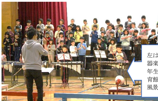
左は3年生の器楽、右は6年生の劇の体育館での練習風景です。