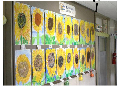
1年生の「ひまわり」の絵です。

学習発表会に合わせて、恒例の全校写生展も開催いたします。各学級の廊下の掲示板上には、子どもたちの力作が展示されておりますので、ぜひお立ち寄りください。なお、この日、絵をご覧になられる方は、お手数ですが、一度校外に出られ、西側児童玄関よりお入りください。