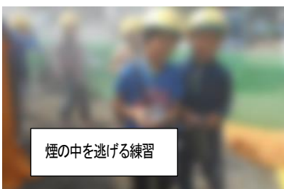
煙の中を逃げる練習