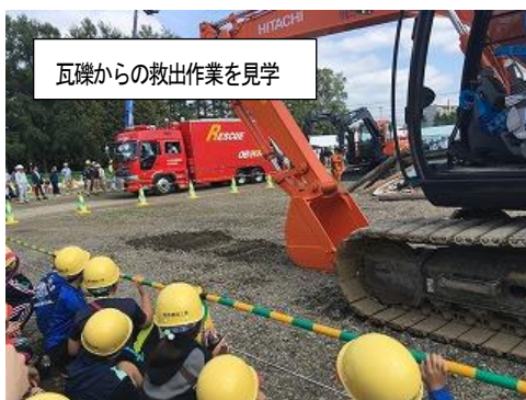
瓦礫からの救出作業を見学

そんなおり、4年生は9月12日(水)に第26回地域防災訓練(宮坂建設工業主催)に参加させていただくことができました。これは2003年の十勝沖地震を機に地域の防災力を高めようと、毎年実施されているものです。子どもたちは消火訓練(バケツリレー、水消火器)、煙体験、炊き出し訓練をしたり、地震体験車に試乗したり、がれき救出訓練を見学したりして、五感を働かせながら緊張感をもって訓練に臨みました。現実には起こらないことを願うばかりですが、心の備えだけはしっかりしておきたいと思います。