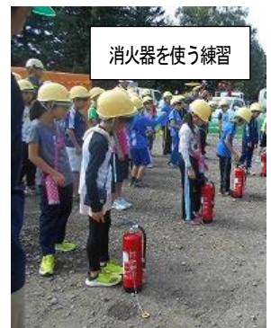
消火器を使う練習