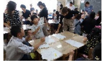
紙皿まわしに挑戦した1年生(図工)

9月21日(金)の全校参観日に多数お越しいただきありがとうございました。お子さんの授業に向かう姿はいかがでしたか?前回の参観日より成長を感じていただけたのではないのでしょうか。学年も折り返しの時期となりました。学習内容をしっかり身に付け、心も体も健やかに成長できるように、全職員で育てていきます。