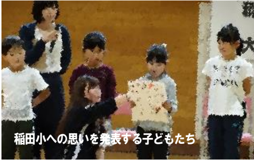
稲田小への思いを発表する子どもたち

9月25日（火）、本校体育館において開校90周年の歴史を振り返る全校道徳が行われました。授業のテーマは「稲田小学校のために、自分が今、大切にしたいことを考えよう」とし、下記のプログラムに沿って一人一人が「学校のよさ」と「これからの自分」について考えました。校長の話では先人の不屈のチャレンジ精神を「稲田魂」と呼び、それぞれの「稲田魂」を育ててほしいと話しました。