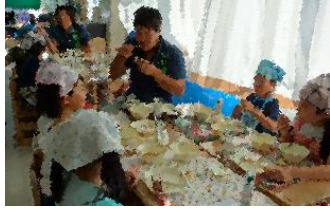
「おいしいよ!」と伝える3年生

9月21日(金)に、JA+勝青年部の皆さんが9名来校し、3年生と一緒に給食を食べました。この日は①勝ちこみごはん(螺湾ブキ、ごぼう、枝豆)②NEW(乳)豚汁③さんまおかか煮④牛乳⑤十五夜デザート。JAと畜大で開発したスペシャルメニューです。生産者の皆さんと食べると一層おいしく感じたようで、笑顔いっぱいの給食時間となりました。