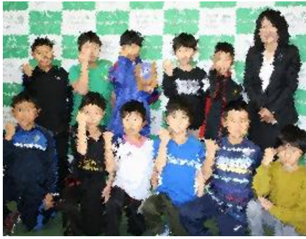
第四回全千勝 U-10フットサルリーグ アロックス優勝 稲田サッカー少年団