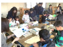
絵具の技法を試す3年生