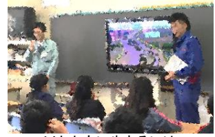
川とともに生きるには・・・

11月21日(水)、5年生は株式会社北開水コンサルタントおよび北海道開発局帯広開発建設部のご協力で、理科「流れる水のはたらき」の出前授業を受けることができました。近年起きている自然災害の一つに「豪雨」があります。雨量が急激に増えた川はどうなるのか知り、それを防ぐ仕事や各自で備えることなどを学びました。