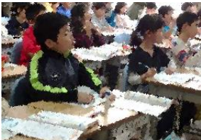
九九の仕組みを考える2年生

11月27日(火)～29日(木)まで、授業参観・懇談会が行われました。お子さんの様子はいかがでしたか?学年の折り返しも過ぎ、大きな行事も終えて、自信をもって学んでいることを感じていただけたら幸いです。懇談会では2学期の様子や評価、冬休みの生活についてお話しさせていただきました。長い2学期もあと1か月です!