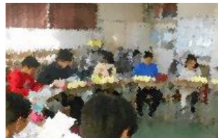
話し合う各校のリーダーたち

11月15日(木)、南町中において第2回市内小中学生いじめ・非行防止ファミリー・サミットが開催されました。エリアの児童会(豊成小・稲田小)と生徒会(南町中)の事務局が「いじめ・非行」をなくす取組について交流。児童・生徒のリーダーが育つことで、子ども自身の判断力を伸ばし、課題克服の力につながることを期待します。