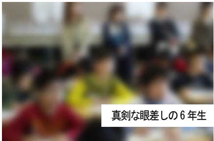
真剣な眼差しの6年生

4月20日(土)の全校参観日に多数ご来校いただき、ありがとうございました。入学・進級してから2週間たったお子さんの姿はいかがでしたか?子どもたちの新しい環境を知り、新学期にけるやる気やがんばりを感じていただけていたら嬉しいです。