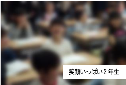
笑顔いっぱい2年生