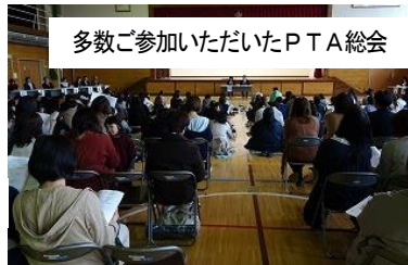
多数ご参加いただいたPTA総会

また、PTA総会にも例年を上回るほど多数ご参加いただきありがとうございました。議事も順調に可決され、新役員も決まりました。90周年が終わり、100年に向かって歩み始める年、学校と家庭・地