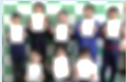
児童会三役と各委員会の委員長のみなさん