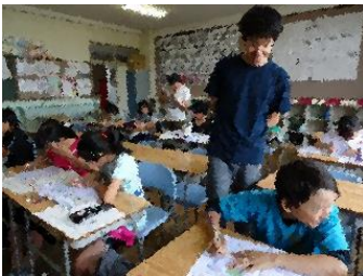
180名も勉強をしにきました!