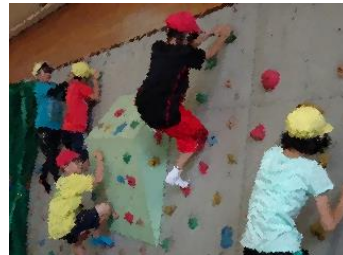
稲田名物、体育館のボルダリング

7月25日(木)に、「学ぼう会、遊ぼう会」が開かれました。参加した約180名の子どもたちは1学期のまとめの問題を解いたり、「玉入れ」「ドッジビー」「ボルダリング」などで、思いきり体を動かしたりしながら夏休みの初日を過ごしました。